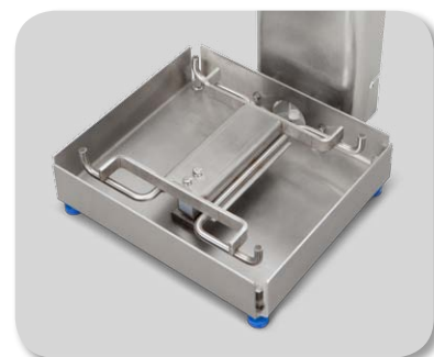
Structure de la base